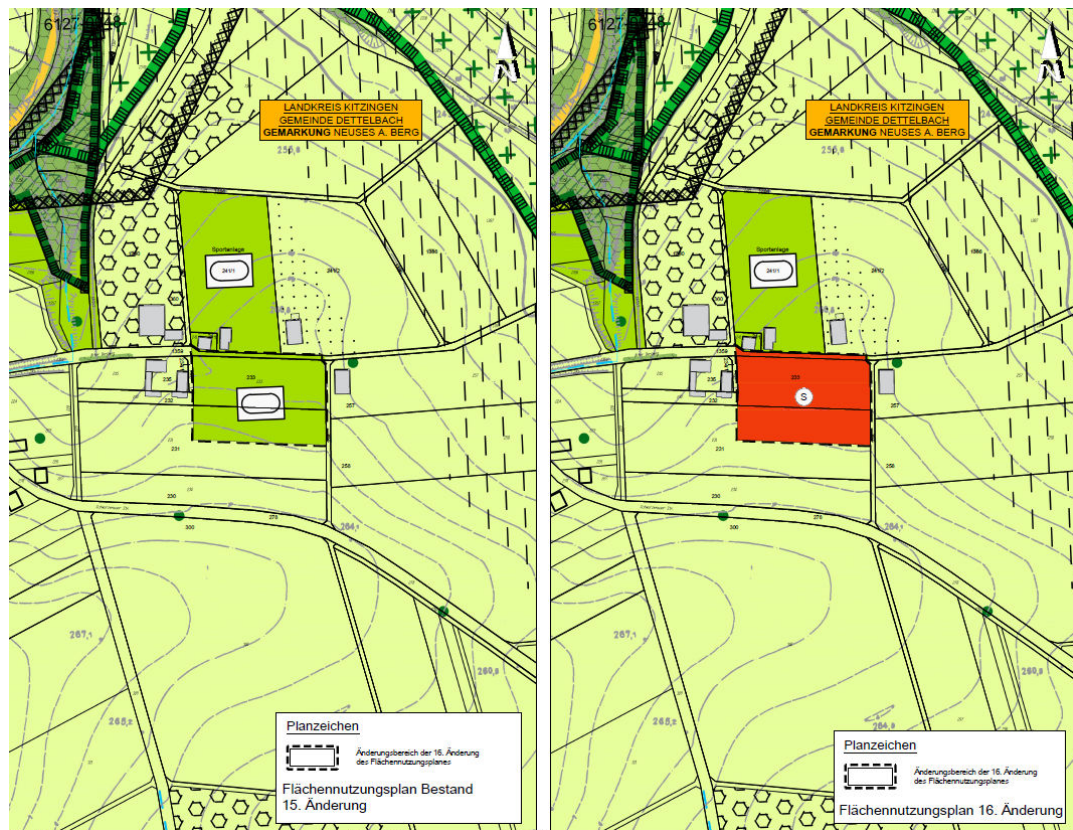
Abbildung 2 Übersicht wirksamer FNP (links) und 16. Änderung (rechts)

Der Geltungsbereich des Bebauungsplans „ALPACAMP“ umfasst lediglich FIST.-Nr. 233 sowie die Teilfläche von FIST.-Nr. 1359 (Gemarkung Neuses am Berg). In der vorliegenden 16. Änderung des Flächennutzungsplans wird jedoch die Nutzungsart der gesamten Sportanlage in Sonderbaufläche geändert (zusätzlich Teilfläche von FIST.-Nr. 231, Gemarkung Neuses am Berg). Aktuell befindet sich die Weide der Alpakas sowie deren Stallungen auf der Teilfläche von FIST.-Nr. 231 (Gemarkung Neuses am Berg). Mit der 16. Änderung des Flächennutzungsplans, wird die Nutzungsart der tatsächlichen Nutzung angeglichen.