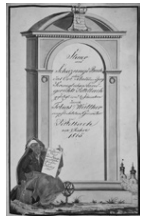
Titelseite im Steuer- und Schatzungsbuch von Neuses am Berg aus dem Jahr 1815.