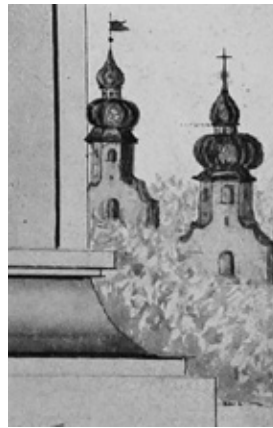
Die beiden Kirchen von Neuses am Berg, Ausschnitt aus der Darstellung im Steuer- und Schatzungsbuch von 1815.

Nach der Reformation Martin Luthers nahmen die Untertanen der Markgrafen von Brandenburg-Ansbach wohl recht bald die protestantische Konfession an. Zu diesem Zeitpunkt bestand nur eine Kirche in Neuses am Berg, die von beiden Konfessionen als Simultaneum genutzt wurde.